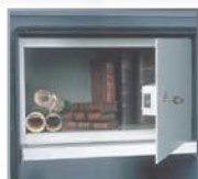
De gauche à droite : tablette, armoire intérieure.